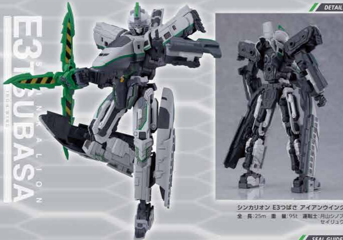
シンカリオン E3つばさ アイアンウイング 全長:25m 重量:95t 運転士:月山シノブ セイリョウ